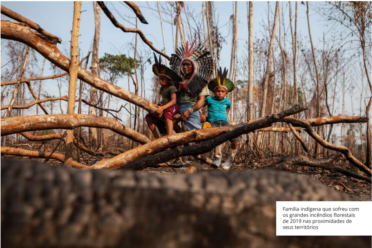
Família indígena que sofreu com os grandes incêndios florestais de 2019 nas proximidades de seus territórios