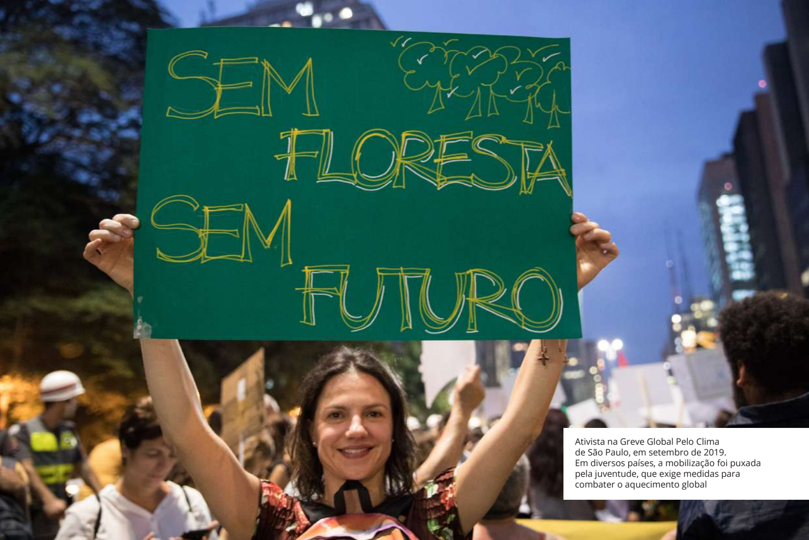
Ativista na Greve Global Pelo Clima de São Paulo, em setembro de 2019. Em diversos países, a mobilização foi puxada pela juventude, que exige medidas para combater o aquecimento global